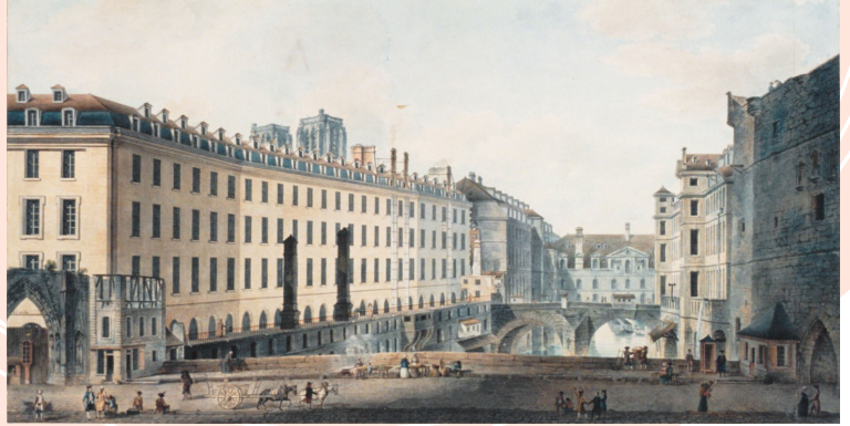
Le Pont au Double l'Hôtel Dieu, Nicolle Victor btvlb7744292v

Riche de près de 400 ans d'histoire , la VMEH se caractérise par des évolutions successives qui lui ont permis au fil des siècles de s'adapter à son époque en prenant toujours à cœur le bien-être du malade hospitalisé ou du résident en Ehpad avec le concours des professionnels hospitaliers et du médico-social.