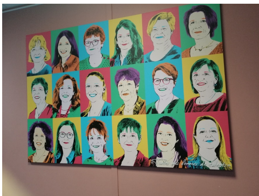
Trombinoscope ayant pour titre « Toutes des femmes de talent »

Arrivés des quatre coins de l'Hérault, nous voilà réunis pour une AG au cœur du Centre Hospitalier de Béziers.