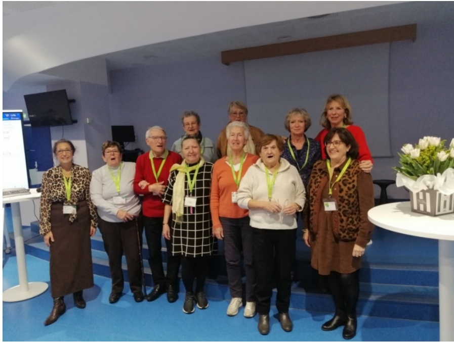
Le C.A. en joie : sur les visages, ça se voit !