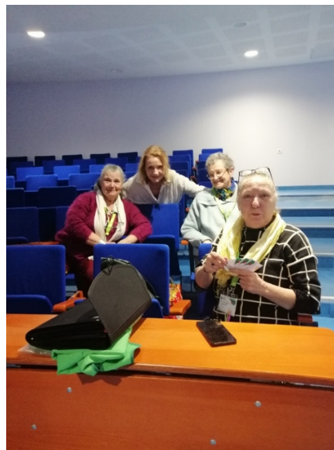
Une équipe soudée et sympathique dans le bel auditorium du Centre Hospitalier de Béziers